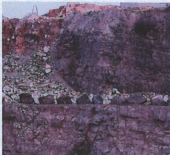
Une vue du calcaire Lunel en carrière. Dans la partie basse, des bancs de calcaire massifs ; au-dessus, le calcaire abattu pour la production de granulats.