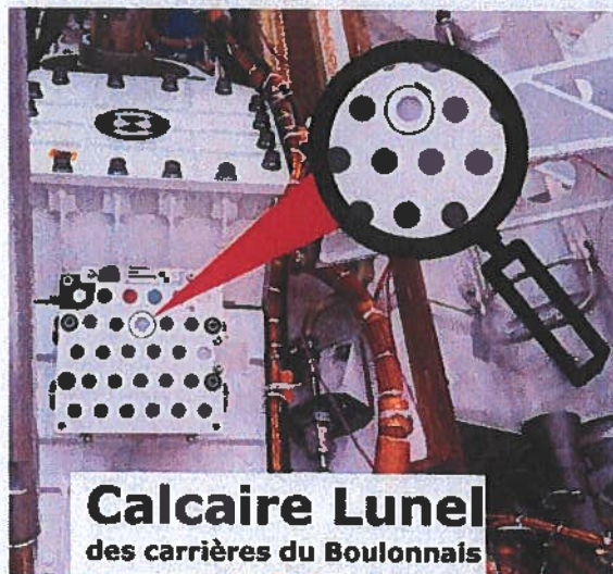
Le calcaire, parmi les autres échantillons, une fois qu'il a été transformé en pastille et installé sur le châssis de l'astromobile.